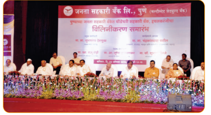
चौडेश्वरी सह. बँक, इचलकरंजी विलिनीकरण समारंभ उपस्थित मा.श्री.चंद्रकांतदादा पाटील