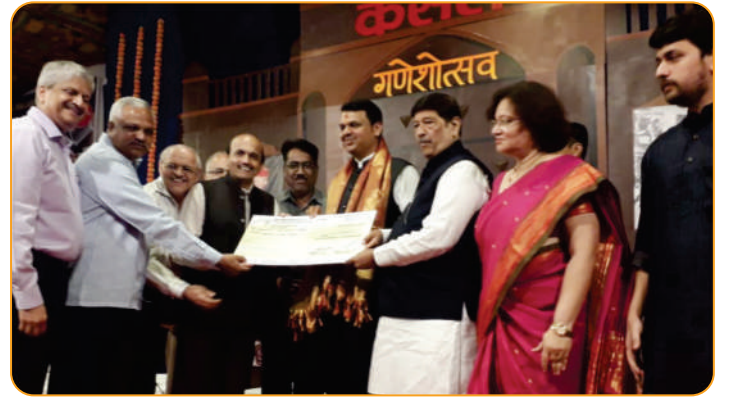
मुख्यमंत्री सहाय्यता निधी प्रदान करताना मा.श्री. लेले व मा.संचालक