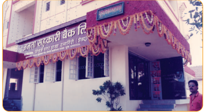
२५ जाने.१९९३ शिवाजीनगर रत्नागिरी शाखा नूतन वास्तूत स्थलांतर