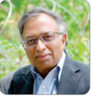
पद्मभूषण डॉ. विजय भटकर महाराष्ट्रभूषण, विख्यात संगणक तज्ञ

जनता सहकारी बँकेच्या वाटचालीतील ७५ वा वर्धापन दिन हा एक मोठा, अभिमानाचा आणि आणखी मोठी झेप घेण्याचा टप्पा आहे. सचोटी, नाविन्य आणि समर्पणाने सेवा देण्याची सुरुवात करून ७५ वर्षे झाली. ग्राहकांच्या सतत बदलणाऱ्या आणि वाढणाऱ्या अपेक्षा पूर्ण करण्यासाठी आपली बँक कार्यरत राहिली. बँकेचा ग्राहककेंद्री दृष्टीकोन, तंत्रज्ञानाच्या प्रगतीत आघाडीवर राहण्याचा प्रयत्न, विवेकपूर्ण आर्थिक व्यवस्थापन आणि समुदाय प्रतिबद्धता या जोरावर बँकेने आर्थिक वादळाशी समर्थपणे सामना करीत सुरक्षित बँकिंग वातावरण कायम टिकवून ठेवले. या साठी बँकेचे संचालक, अधिकारी आणि कर्मचारी या सर्वांचे योगदान लक्षणीय आहे. अशीच उत्तरोत्तर प्रगती करीत बँकेच्या सर्व स्टेकहोल्डर्स चे समाधान आपल्याकडून साधले जावो ही शुभेच्छा !