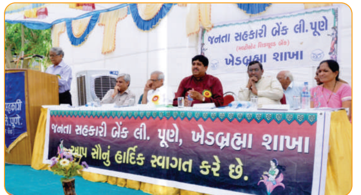
विलीनीकृत खेडब्रह्मा शाखा उद्घाटन समारंभ