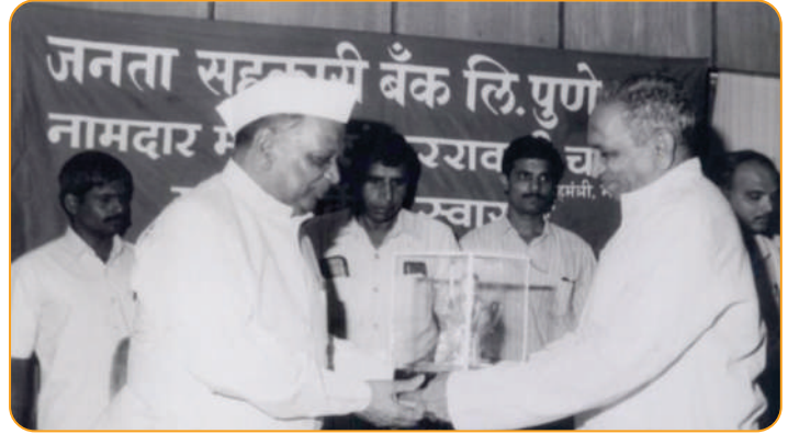
गृहमंत्री मा.श्री.शंकरराव चव्हाण यांची बँकेस सदरिच्छा भेट