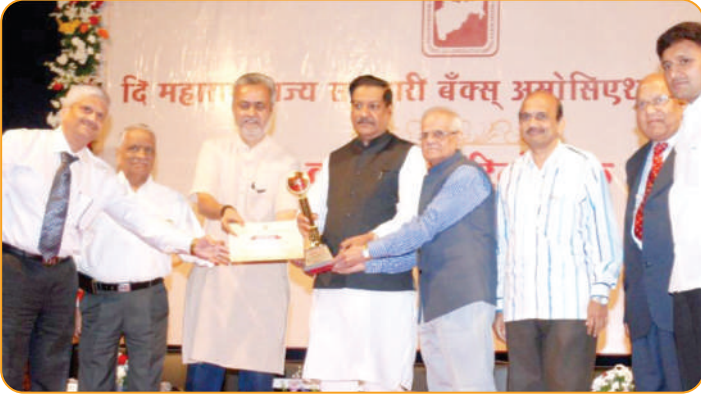
मा. श्री. पृथ्वीराज चव्हाण, मुख्यमंत्री महाराष्ट्र राज्य यांच्या हस्ते पुरस्कार स्वीकारताना