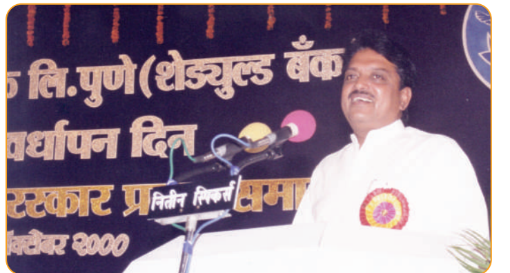
मा.श्री. विलासराव देशमुख मुख्यमंत्री महाराष्ट्र राज्य वर्धापन दिन कार्यक्रमात