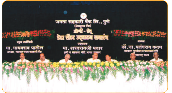
डेटा सेंटर उद्घाटन समारंभ शुभहस्ते मा.श्री.शरदराव पवार व मान्यवर