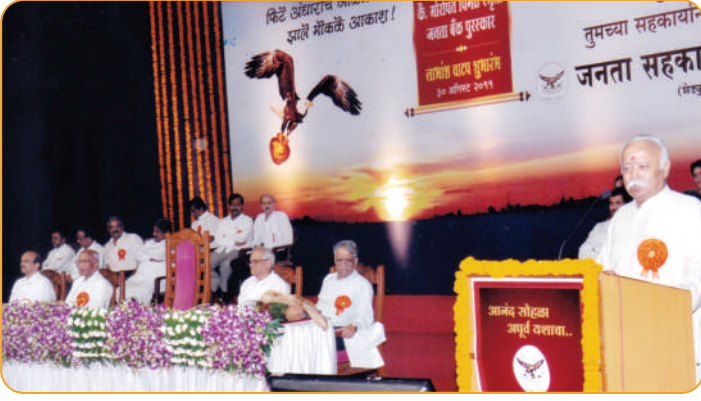
प.पू. सरसंघचालक मा. श्री.मोहनजी भागवत आनंद सोहळ्यात मार्गदर्शन करताना