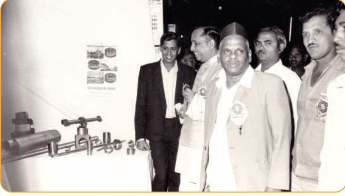
रौप्यमहोत्सवी वर्षानिमित्त खातेदारांच्या औद्योगिक उत्पादनांची प्रदर्शनी