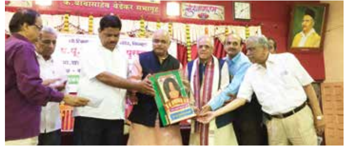
लो. टिळक स्मारक वाचन मंदिराच्या वतीने देण्यात येणारा प.पू. डॉ. हेडगेवार पुरस्कार यंदा जनता सहकारी बँक पुणे या संस्थेच्या सामाजिक कार्यासाठी प्रदान करण्यात आला.