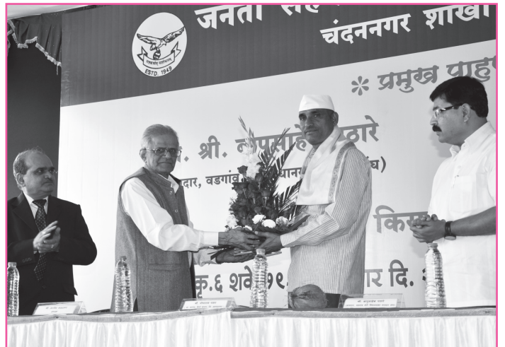
चंदननगर शाखा शुभारंभ.