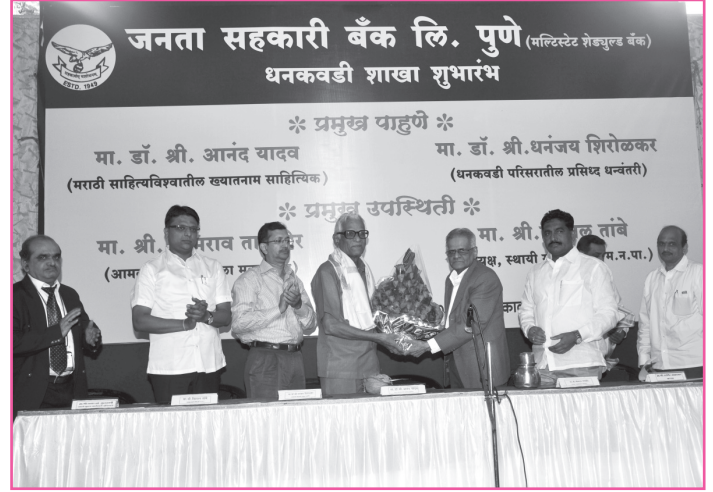
धनकवडी शाखा शुभारंभ.