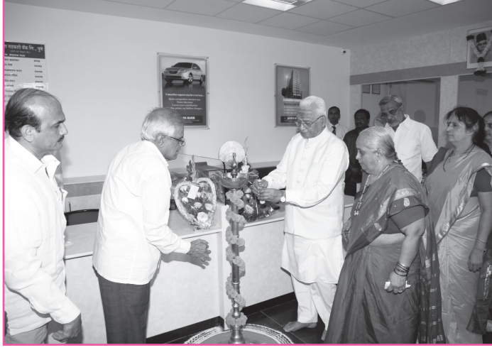
बाणेर शाखा शुभारंभ.