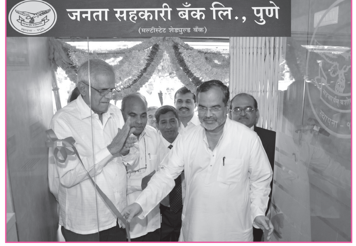
पौड रोड शाखा शुभारंभ.