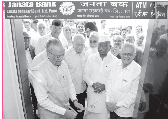
जालना रोड, औरंगाबाद शाखा शुभारंभ.