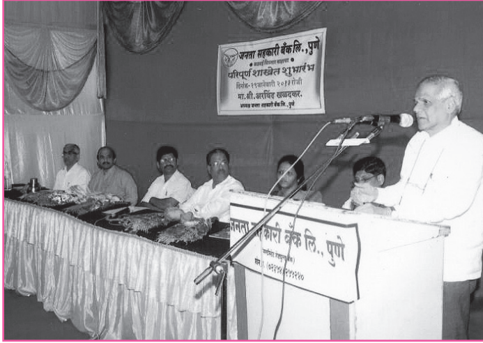
कडवई शाखेच्या लॉकर सुविधेस प्रारंभ.