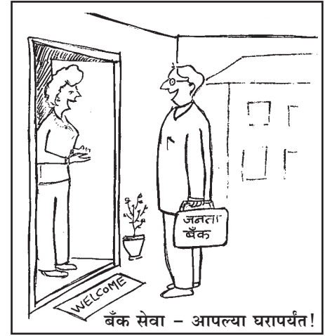
चित्र : आनंद ताडला

दि. २६.०६.२०१४ रोजी सकाळी ९.३० वाजता शाखेमध्ये अभियानाच्या समारोपाचा कार्यक्रम घेण्यात आला. मा.सहमहाव्यवस्थापक